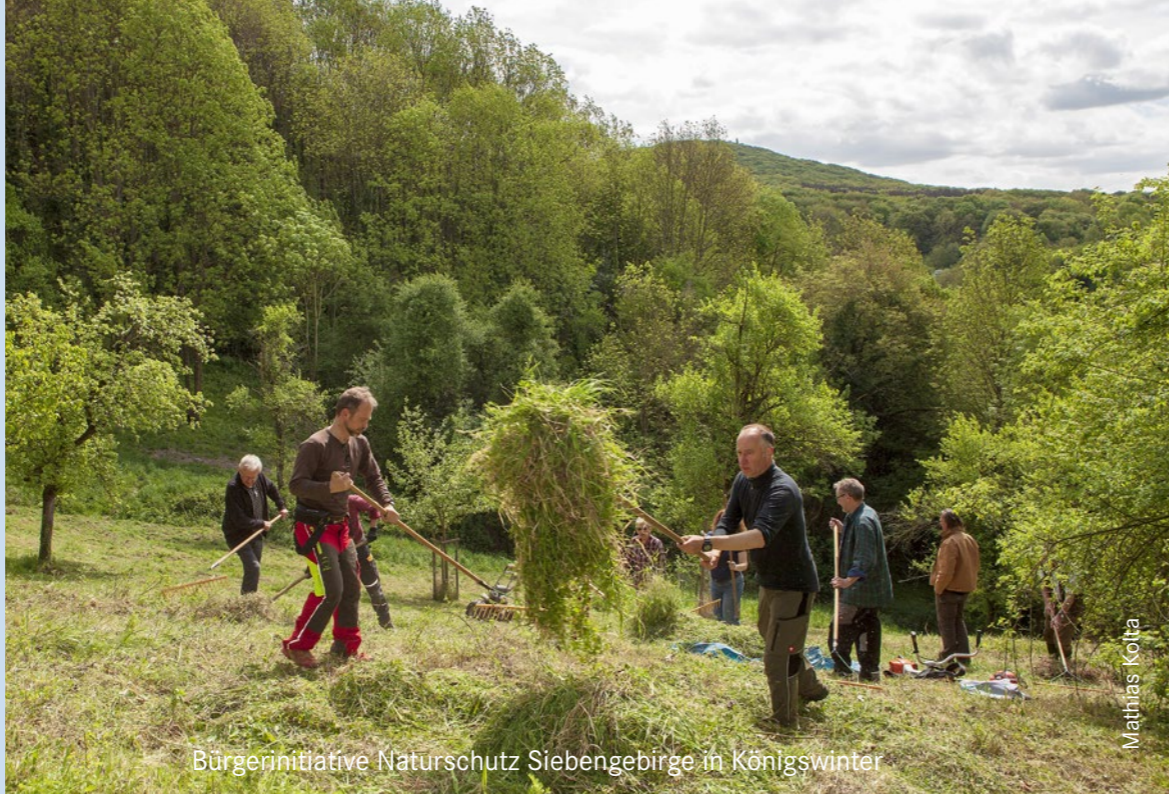
Bürgerinitiative Naturschutz Siebengebirge in Königswinter

Ihre Aufgaben finanziert die NRW-Stiftung überwiegend aus Lotterierträgen über den Landeshaushalt. Immer wichtiger sind aber auch die Spenden und Mitgliedsbeiträge der Partner und Mitglieder im Förderverein NRW-Stiftung, der die Arbeit der Stiftung finanziell und ideell unterstützt.