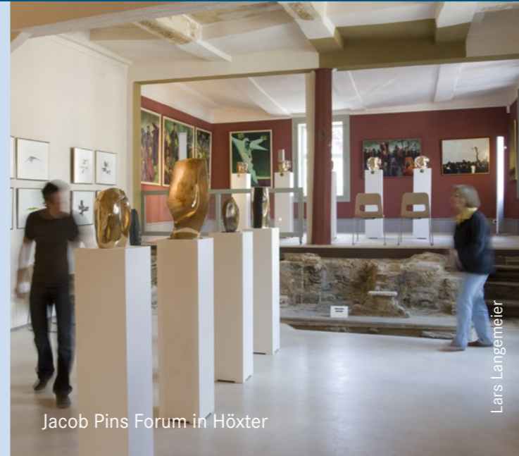
Jacob Pins Forum in Höxter

Außerdem fördert sie die Einrichtung von regionalgeschichtlichen Museen und den Erwerb von bedeutenden Kulturgütern und Zeugnissen unserer Landesgeschichte.