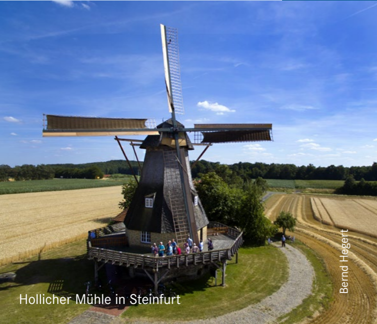
Hollicher Mühle in Steinfurt